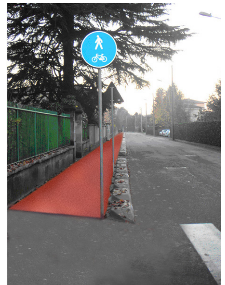
La pista di Via Marconi come sarà a lavori ultimati

A seguito della realizzazione della strada di arroccamento (John Lennon) la viabilità è modificata nel seguente modo: