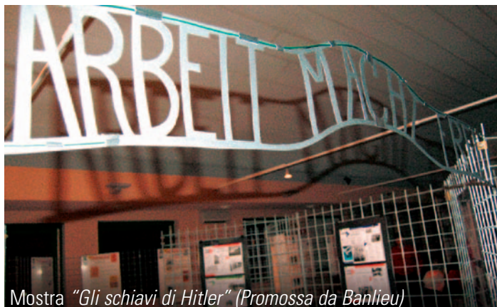
Mostra "Gli schiavi di Hitler" (Promossa da Banlieu)

La Biblioteca Comunale è anche luogo di incontro, di crescita e di condivisione. In questa pagina, immagini scattate durante lo svolgimento di alcune attività promosse dalla biblioteca.