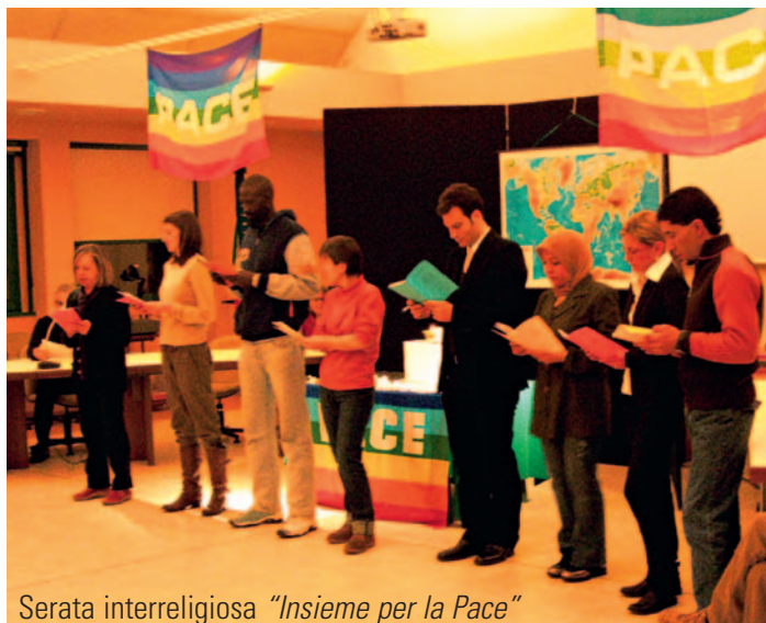
Serata interreligiosa "Insieme per la Pace"

L'Amministrazione intende coinvolgere i cittadini in questo processo e renderli partecipi delle decisioni. Verranno pertanto organizzate assemblee pubbliche e si promuoverà il dibattito per poter fare emergere le idee di tutti i cittadini. Chiediamo soltanto che, accantonati gli egoismi personali, le proposte scaturiscano dal desiderio di lasciare ai nostri figli un paese serenamente vivibile. Invitiamo pertanto la cittadinanza a iniziare sin d'ora a interrogarsi su questa tematica fondamentale.