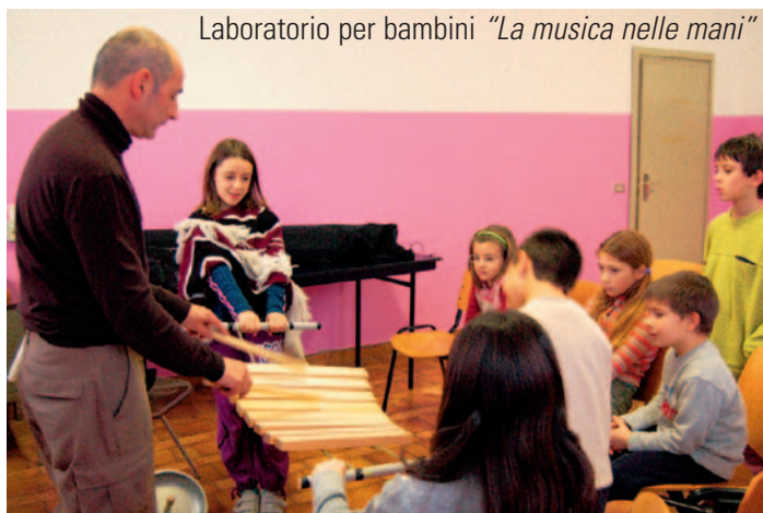
Laboratorio per bambini "La musica nelle mani"